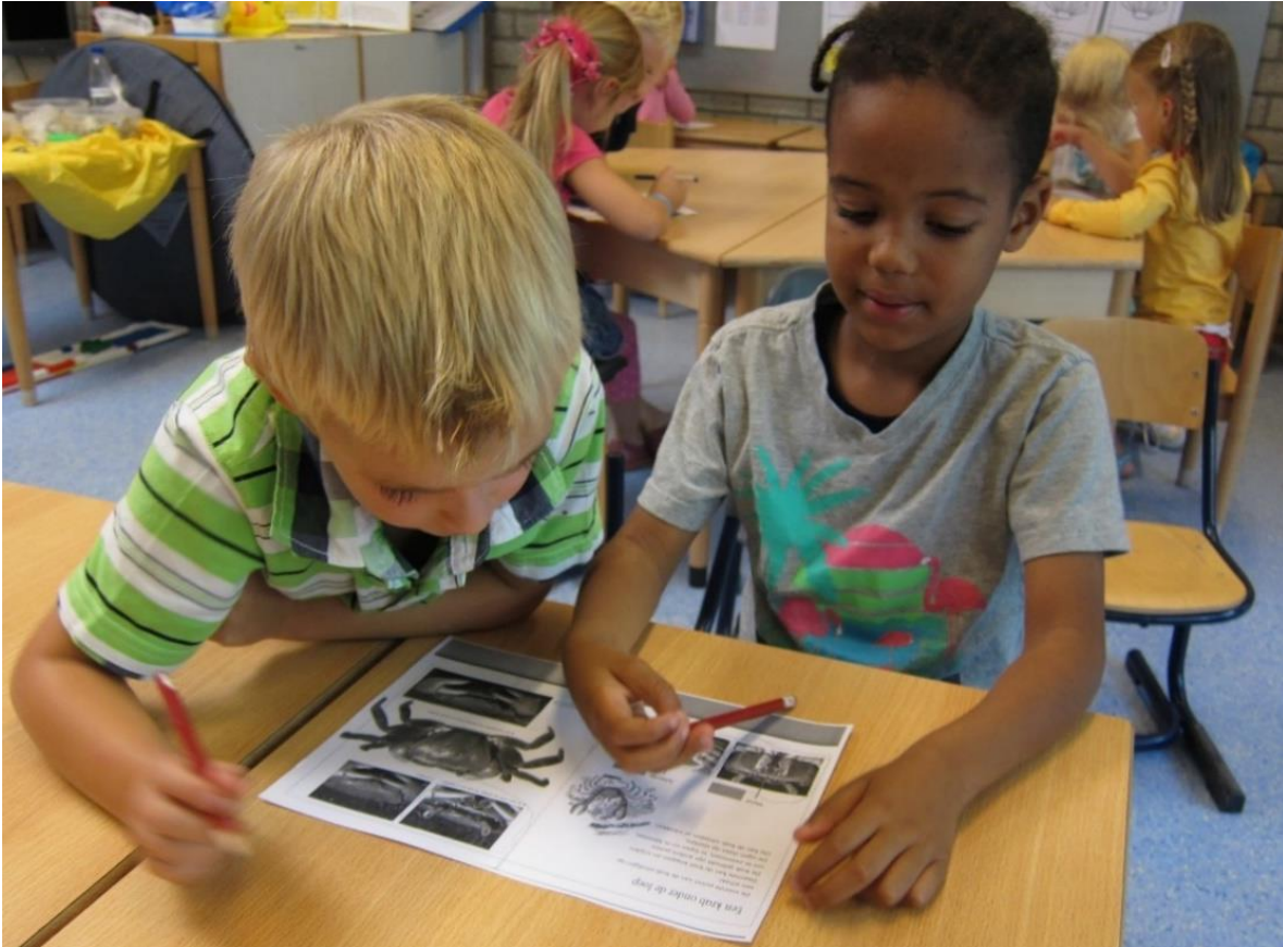
Expertlezen in een groep 2/3

Een goede lezer word je als je teksten leest die je raken. Je hebt wat met het onderwerp, het idee, het verloop van het verhaal of de schrijver. De motivatie om aan een boek of tekst te beginnen heeft veelal te maken met interesse voor zaken uit de leefwereld van de kinderen, de kwesties die op hen afkomen of de vragen die zij hebben. Het lezen van fictieve en non-fictieve teksten verbonden aan wereldoriënterende inhoud die in het thema en onderzoek centraal staan is onze insteek. In Ontwikkelingsgericht Onderwijs leren we kinderen hun eigen vragen en de vragen van de groep onderzoeken door middel van allerlei onderzoeksactiviteiten, waaronder bronnenonderzoek. Teksten, boeken en filmpjes worden ingezet als bron. Rijke onderzoeksactiviteiten maken dat je als leerling uitgedaagd voelt om je te verdiepen in complexe teksten. De leerkracht ondersteunt door de leesdidactiek en begeleiding gericht in te zetten zodat alle leerlingen zin in lezen krijgen en houden!